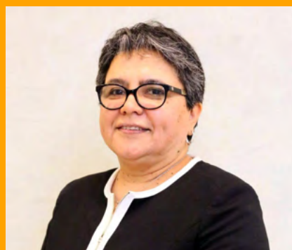
Raquel Buenrostro Sánchez

Egresado de la Maestría en Economía, 1989-1991. Director Global de Gobernanza del Banco Mundial.